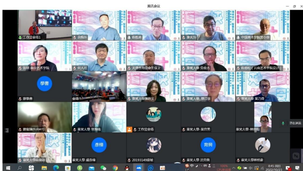
图2 第六届“海峡设计·智慧生活”设计工作营